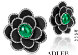
Boucles d'oreilles Shisai en or blanc et carbone serties d'émeraudes.