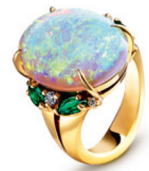
Bague Fleur en or blanc et diamants sertie d'un rubis.