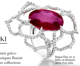
Bague Fleur en or blanc et diamants sertie d'un rubis.