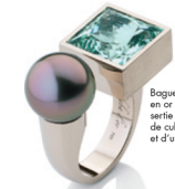
Bague 'Ici et Moi' en or champagne, sertie d'une perle de culture de Tahiti et d'un béryl vert.