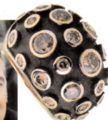
BAGUE NAUTILUS EN OR ROUGE ET OR ROSE SERTIE DE DIAMANTS BRUNS