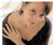
COLLIER BALERNE EN OR COULEUR CHAMPAGNE ET PERLES DE CULTURE ANDRA